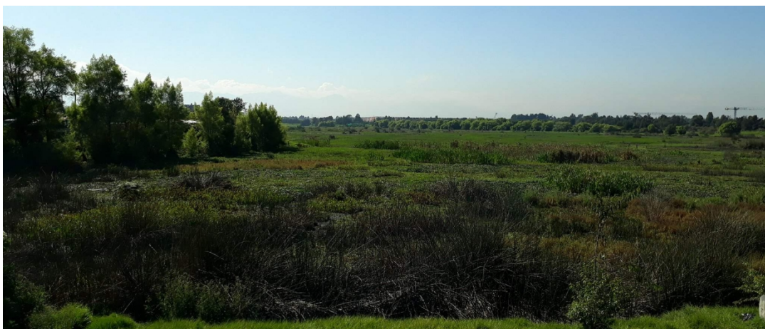
Imagen No. 1. Humedal Juan Amarillo, sector Lisboa.

También llamado laguna de Tibabuyes, se encuentra al noroccidente de la ciudad, dentro del área inundable de los ríos Bogotá y Juan Amarillo o Salitre. Es el humedal más grande que sobrevive actualmente en la ciudad con un área total de 222.76 hectáreas, de las cuales 201.37 hectáreas corresponden a la ronda hidráulica. Se encuentra en jurisdicción de dos localidades la porción norte a la localidad de Suba y la sur a la localidad de Engativá.